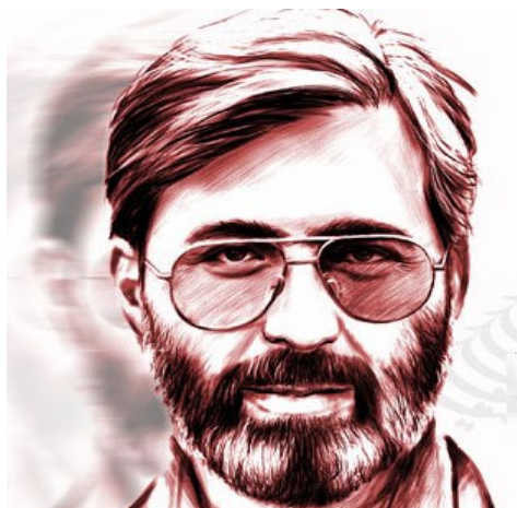
سید شهیدان اهل قلم

«خداوندی که با قلم آموخت، به انسان تعلیم کرد آنچه را که نمی دانست.»